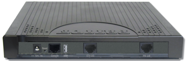
Passerelle 2-ports Ethernet évolutive eSBC